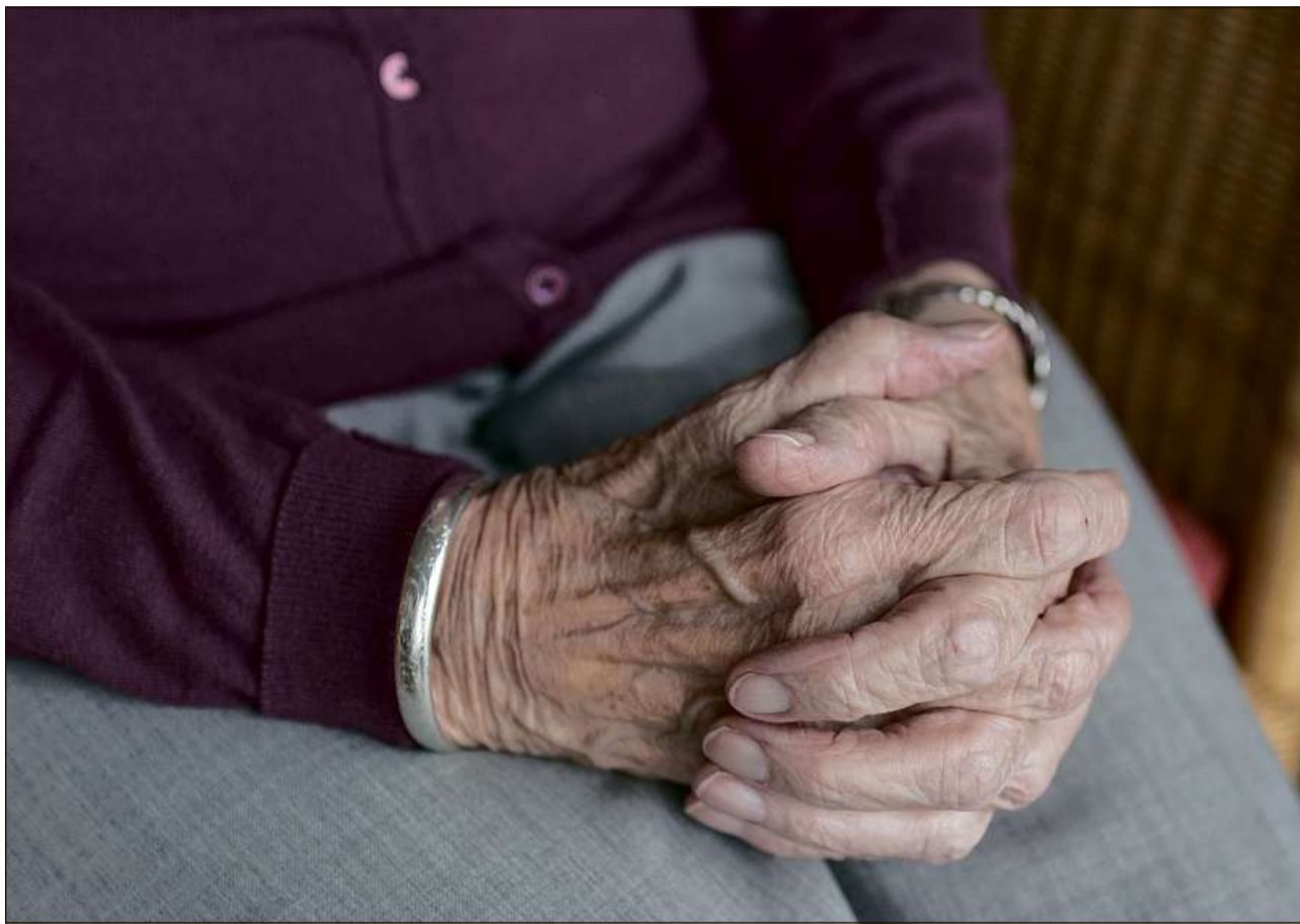
Dapi il 1948 porscha l'assicuranza per vegls e survivents prestaziuns finanzialas statalas per la saira da la vita.

Il malruus social ch'ha tutgà la Svizra a la fin da l'Emprima Guerra mundiala (Chauma generala dal november 1918) ha intimà per in tschert temp il stadi da pratitgar ina politica sociala pli activa. Da quai è resultada il 1925 l'obligaziun constituziunala da la Confederaziun da metter ad ir in'assicuranza per vegls e survivents e la cumpetenza federala areguard l'assicuranza d'invalids. En cumparegliaziun cun il svilup en auters pajais ha la Svizra però pers ils proxims onns adina dapli terren. Pir l'onn 1940 è